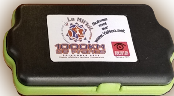
Balise Solustop SK06 portée par chaque concurrent

Le suivi en temps réel et les classements seront assurés par SoluWeb , la plateforme de Solustop, et à partir du site de course à pied YaNoo , partenaire de Solustop pour les courses.